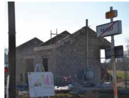
station de vide et de relèvement

La communauté d'agglomération Reims Métropole a souhaité raccorder le village à la station d'épuration de Reims, toute proche, et dont la capacité épuratoire le permet.